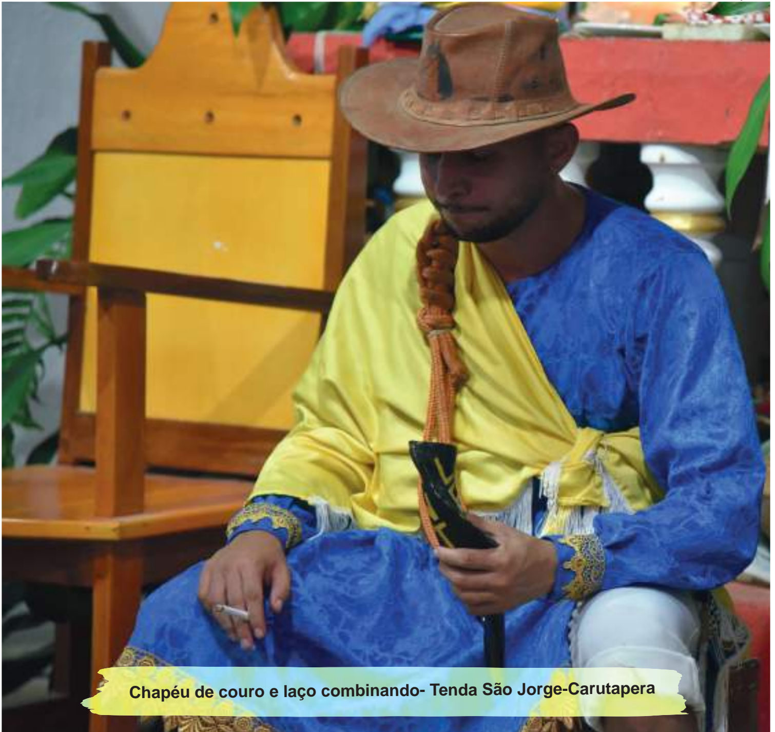
Chapéu de couro e laço combinando- Tenda São Jorge-Carutapera