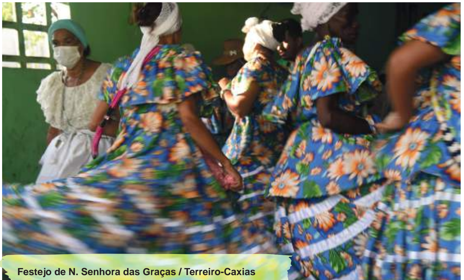
Festejo de N. Senhora das Graças / Terreiro-Caxias