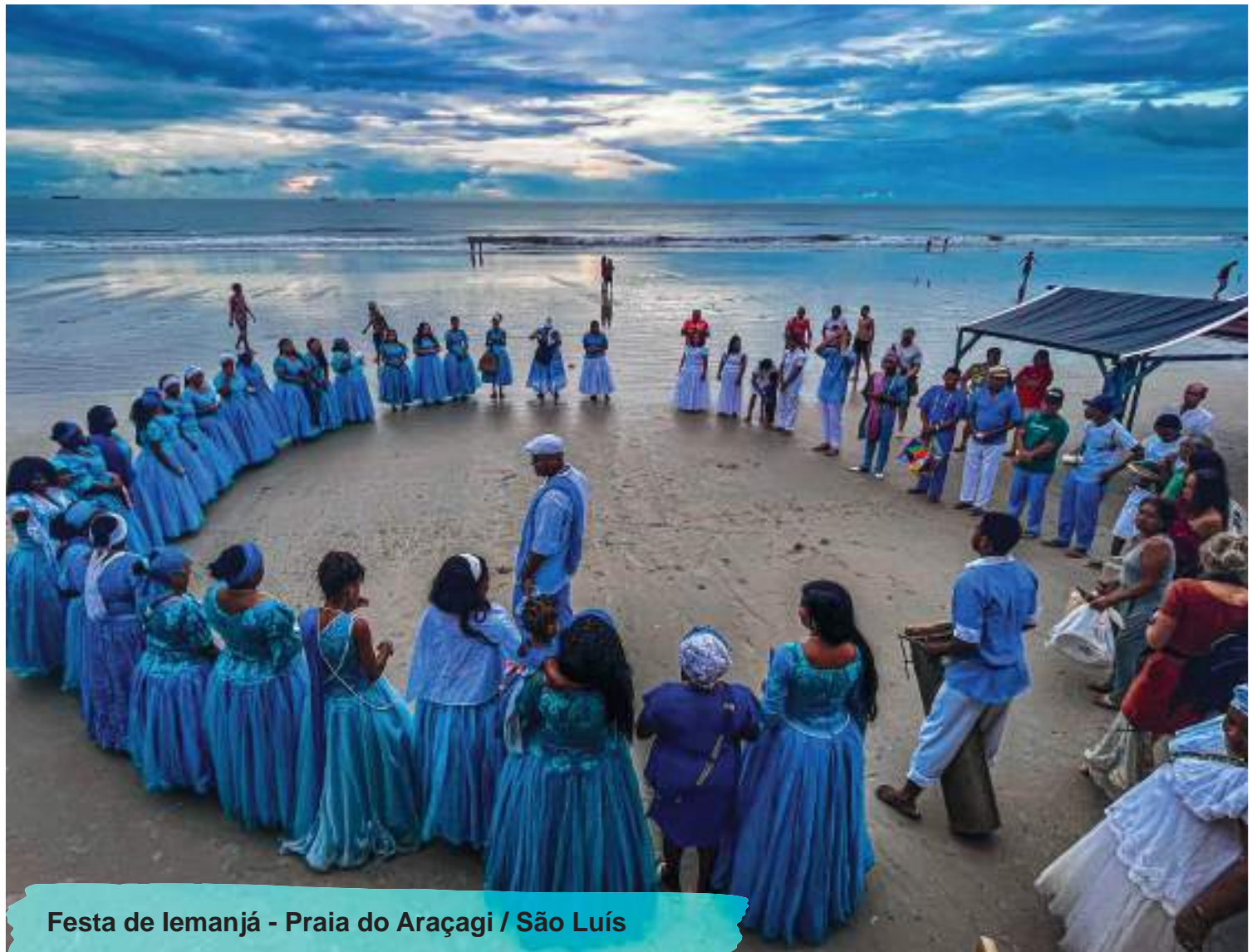
Festa de Iemanjá - Praia do Araçagi / São Luís