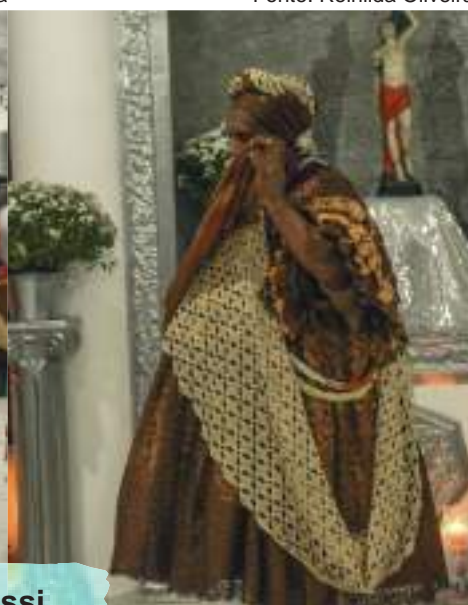
Painas- Terreiro Camafeu de Oxóssi