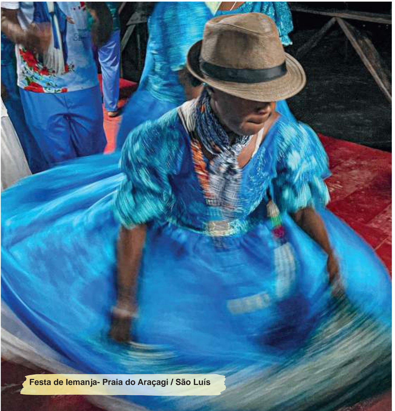
Festa de Iemanjá- Praia do Araçagi / São Luís