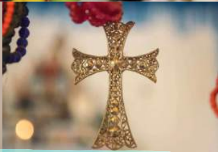
Diversidade de cores, forma, tamanhos e detalhes das guias /rosários