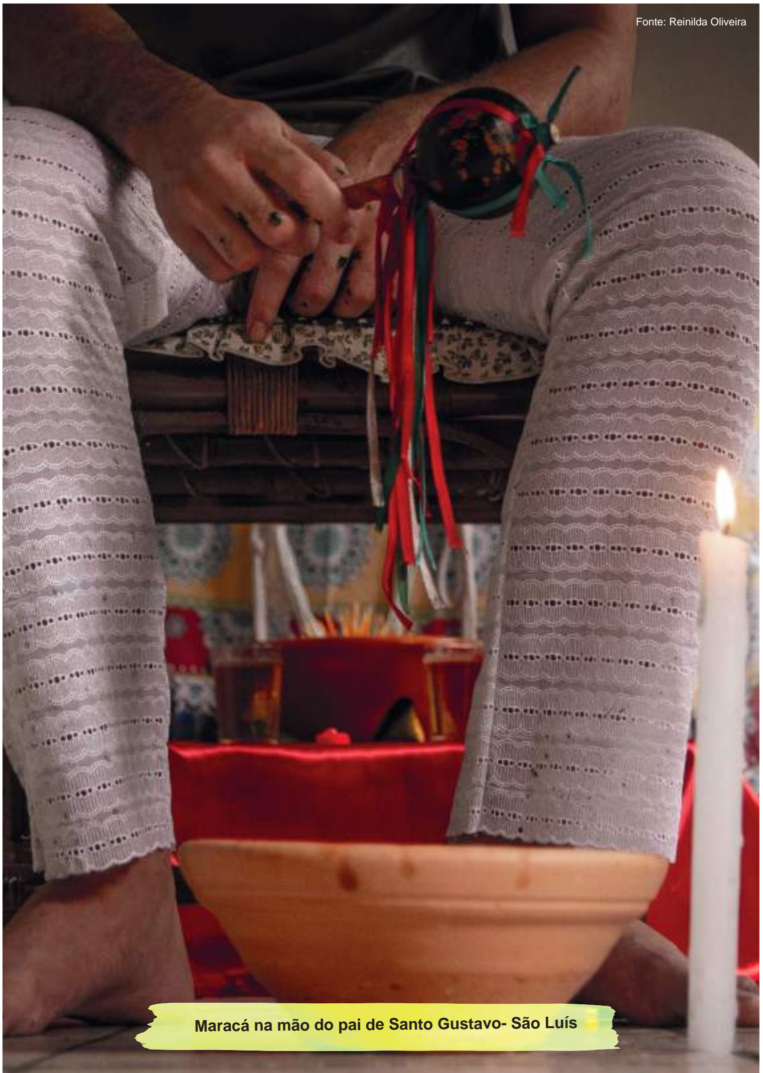
Maracá na mão do pai de Santo Gustavo- São Luís