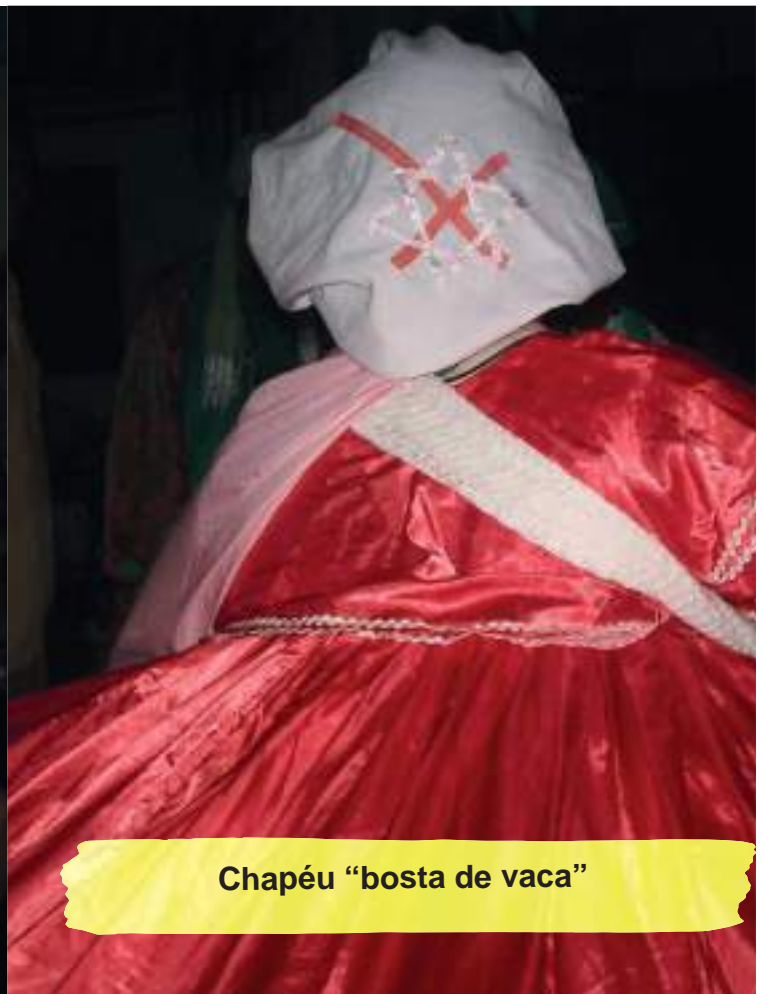
Chapéu “bosta de vaca”