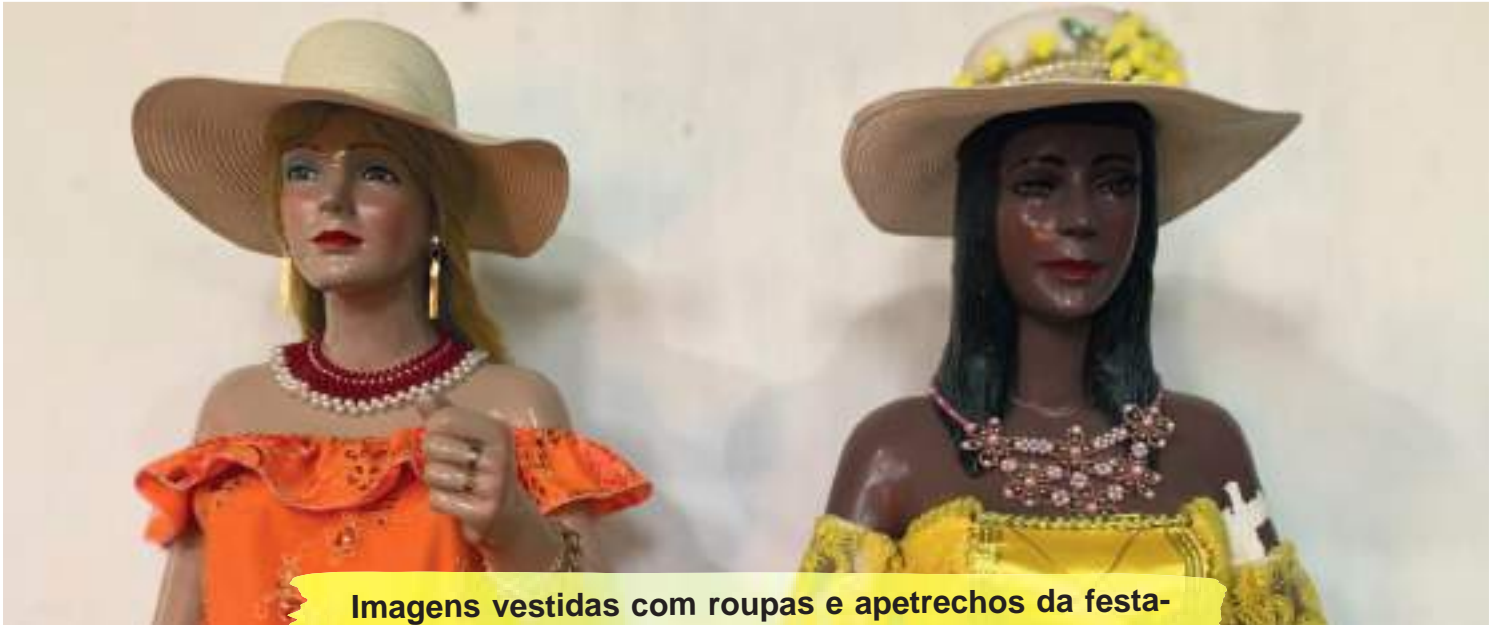
Imagens vestidas com roupas e apetrechos da festa-Tenda São Jorge/ Carutapera

Outros apetrechos fazem parte desse rico universo como joias (colares, terços, anéis, brincos, pulseiras); Gravata (lenço amarrado no pescoço, utilizado por encantado masculino); Leques (utilizado por princesas, pomba gira); Coroas (característico dos pais de santo da Baixada Maranhense); Diademas dos indígenas (usado em festa de índio) e tantos outros que seguem o gosto do encantado ou das pessoas que os recebem.